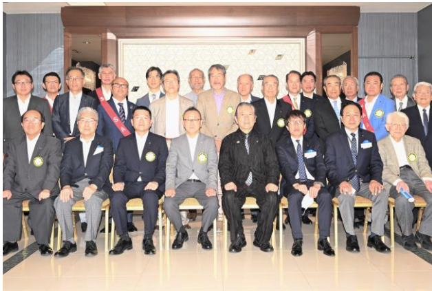
<野生司ガバナーと共に>