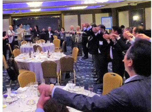
フィナーレ「手に手」～次年度もよろしく！～