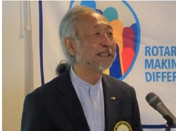
平井今年度北分区ガバナー補佐