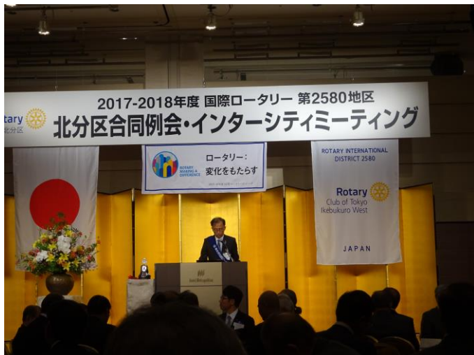
富重会長/開会点鐘、開会宣言