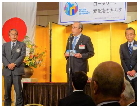
次年度ガバナー補佐紹介